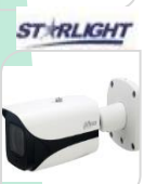
CVI-HAC- HFW3802EP-ZH € 640,00

BULLET 4K STARLIGHT – 8 Mp - HDCVI/TVI/CVBS/AHD - LENTE 3.7-11mm MOTORIZZATA 120dB True WDR,3DNR- risoluzione -MAX 4K – HD/SD switchable - 1 INGRESSO AUDIO - Max.IR 80mt Smart IR – iP67 –2D/3D – Day/Night -2 IR LED- AC24V/DC12V- ALLUMINIO ACCESSORI OPZIONALI: PFA130E – PFA122 - PFA152E PFA151 * DIMENSIONI : 244.1x90.4x90.4mm * PESO : kg 1.05