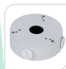
SE-PFA13G € 28,00

WATER-PROOF BOX DI GIUNZIONE - MATERIALE: IN ALLUMINIO & SECC – BIANCO DIMENSIONI: ø160mm x 41,5mm PESO: Kg 0,87 CARICO: 3 Kg TEMPERATURA -40°C +60°C UMIDITA': <90% RH