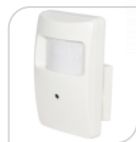
4/1 SE-ATC1080GIR € 122,00

TELECAMERA 4 IN 1 -AHD/TVI/CVI/Analog – mini PIR CAM finto sensore 2.1Megapixel 1080P, UTC, D-WDR,3D NR , lente 3.7mm pinhole con 18 mini led invisibili- IR Distanza 5-10Mt – snodo incluso