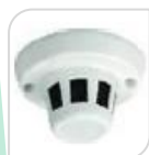
4/1 SE-SMK-36 € 66,00

TELECAMERA 4 IN 1 "1/2.8" STARLIGHT D-WDR 3DNR CMOS AHD/TVI/CVI/CVBS SONY IMX291 2.0Mp+FH8550D/1080/TVI/AHD/CVBS 3.7 mm PINHOLE LENS, con AUDIO