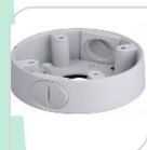
SE-PFA13A-E € 25,00

BOX DI GIUNZIONE A PARETE RESISTENTE ALL'ACQUA MATERIALE: IN PLASTICA RESISTENTE AGLI AGENTI ATMOSFERICI- BIANCO DIMENSIONI: 210,9x97,5x35mm PESO: kg 0.10 CARICO: Kg 0.300 TEMPERATURA -40°C +60°C UMIDITA' <90%RH