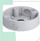
SE-PFA132-E € 49,00

WATER-PROOF BOX DI GIUNZIONE – MATERIALE: IN ALLUMINIO - BIANCO DIMENSIONI: 123x37,2 mm PESO: kg 0.22 CARICO: 3Kg TEMPERATURA -40°C +60°C UMIDITA' <90%RH