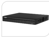
XVR5116HS-S2 € 480,00