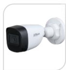
CVI-HAC- HFW1500C € 87,00