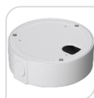
SE-PFA131 € 24,00

WATER-PROOF BOX DI GIUNZIONE – MATERIALE: IN ALLUMINIO & SECC - BIANCO PROTEZIONE: IP66 – DIMENSIONI: 90x36,1mm – PESO: kg 0.24 CARICO: 1Kg TEMPERATURA -40°C +60°C UMIDITA': <90% RH