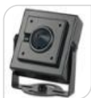
4/1 SE-ATC4MPA € 170,00

DOME IR 4.0Mega Pixel (2500*1600p) - uscita HDCVI/TVI/AHD/CVBS 4 Megapixel - Obiettivo varifocale 2,8/12 mm - LED 36 - Distanza IR 25m Day/Night con filtro meccanico - IP66 in Case Metallico - DC12V * DIMENSIONI 119x 98 mm