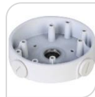
SE-PFA139 € 25,00

WATER-PROOF BOX DI GIUNZIONE – MATERIALE: IN ALLUMINIO - BIANCO DIMENSIONI: 161x38mm – PESO: kg 0.45 CARICO: 3Kg TEMPERATURA -40°C +60°C UMIDITA' <90%RH