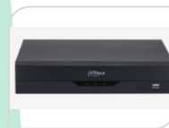
XVR5232AN-I3 € 1.180,00