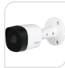
CVI-HAC- B2A21P € 72,00

IR BULLET 2,0 Mp HDCVI - obiettivo fisso da 3,6mm - Max. 30 fps @ 1080P - Uscita HD e SD commutabile - Max. Lunghezza IR 20 m, Smart IR - P67, DC12V - SERIE COPPER - luminosità 0.04Lux/F1.85, 30IRE, 0Lux IR on. - PLASTICA ACCESSORI OPZIONALI: PFA134 - PFA152-E *DIMENSIONI: 149.3 mm x 69.8 mm x 69.8 mm *PESO: Kg 0,14