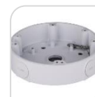
SE-PFA138 € 34,00

WATER-PROOF BOX DI GIUNZIONE – MATERIALE: IN ALLUMINIO - BIANCO DIMENSIONI: 122x34,2mm – PESO: kg 0.24 CARICO: 1Kg TEMPERATURA -40°C +60°C UMIDITA' <90% RH