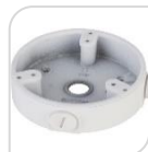
SE-PFA137 € 25,00

WATER-PROOF BOX DI GIUNZIONE – MATERIALE: IN ALLUMINIO - BIANCO DIMENSIONI: 110x33,5mm – PESO: kg 0.18 CARICO: 1Kg TEMPERATURA -40°C +60°C UMIDITA' <90% RH