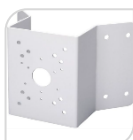
SE-PFA151 € 80,00

STAFFA DA PALO MATERIALE: SECC BIANCO DIMENSIONI: 130,4x170x45mm DIAMETRO PALO: Ø80-150mm TEMPERATURA:<40°C+60°C UMIDITA':<90%RH PESO: Kg 1.1 CARICO: Kg 10