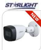
CVI-HAC- HFW1231CM € 96,00

IR BULLET 2.0 Mp - STARLIGHT - 4IN1 HDCVI/TVI/CVBS/AHD - obiettivo fisso 3.6mm - Max risoluzione 1080P frame 30fps@1080P 25/30/50/60fps@720P da esterno/interno IP67 - sensore CMOS progressivo 1/2.7" ; luminosità 0.005Lux (0 con LED ON), 1 led IR portata fino a 20m, 2D, uscita video HD-CVI, alimentazione 12V-Digital WDR-AGC-2D NR- in dotazione staffa di fissaggio - IP67- ALLUMINIO ACCESSORI OPZIONALI: PFA134 - PFA152-E - (PFM820 telecomando per cambio tecnologia) *DIMENSIONI: 176x72.4x72.5mm *PESO: Kg 0.34