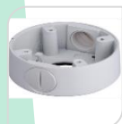
SE-PFA13C € 25,00

WATER-PROOF BOX DI GIUNZIONE – MATERIALE: IN ALLUMINIO - BIANCO DIMENSIONI: 96,8x37,2mm – PESO: kg 0.17 CARICO: 1Kg TEMPERATURA -40°C +60°C UMIDITA' <90%RH