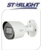
CVI-HAC- HFW1230TP € 99,00

IR BULLET 2.0 Mp - 4IN1 HDCVI/TVI/CVBS/AHD - 2.8mm - Max risoluzione 1080P frame 30fps@1080P 25/30/50/60fps@720P da esterno/interno IP67 - sensore CMOS progressivo 1/2.7" , luminosità 0.02Lux (0 con LED ON), 1 led IR portata fino a 20m, 2D, uscita video HD-CVI, alimentazione 12V-Digital WDR-AGC-2D NR- in dotazione staffa di fissaggio - IP67, MICROFONO - ALLUMINIO ACCESSORI OPZIONALI: PFA134 - PFA152-E (PFM820 telecomando per cambio tecnologia) *DIMENSIONI: 176x72.4x72.5mm *PESO: Kg 0.34