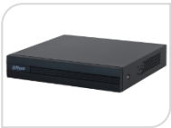
XVR1B08-I € 205,00