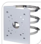
SE-PFA150 € 76,00

STAFFA DA PALO MATERIALE: ALLUMINIO DIMENSIONI: 125,6X114X20 DIAMETRO PALO: 80-150mm TEMPERATURA: <40°C+60°C UMIDITA': <90% RH PESO: Kg 0,27 CARICO: Kg 3