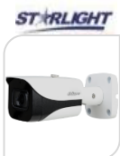
CVI-HAC- HFW2802EP-A € 218,00

BULLET 4K STARLIGHT –8 Mp - HDCVI/TVI/CVBS/AHD - LENTE 3.6mm -120dB - True WDR, 3DNR- risoluzione - MAX 4K – HD/SD switchable-1 ingresso AUDIO- Max IR distanza 80m Smart IR – iP67 –2D/3D Day/Night -4 IR LED- AC24V/DC12V Materiale: ALLUMINIO ACCESSORI OPZIONALI: PFA122- PFA130-E PFA152E PFA151 * DIMENSIONI : 244x79x75.9(90.A)mm * PESO : kg 0.53