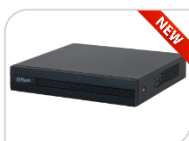
XVR1B04H-I € 190,00