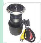
4/1 ST-DV02H96 € 189,00

SMOKE CAMERA 4 IN 1 – "1/2.9" SONY IMX323 CMOS AHD/TVI/CVI/CVBS - 2.0 Megapixel 1082 / LENS 3.6mm – Dip switch *DIMENSIONI: 120X55mm