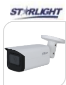
CVI-HAC- HFW2501TUP-A € 219,00

BULLET 5MP HDCVI/TVI/CVBS/AHD 5.0Mp , ottica 2,8 mm 1/2.8" CMOS risoluzione , D-WDR, 2DNR, BLC/HLC/ 0.02Lux/F1.6, 30IRE, 0Lux IR , IR distanza 30m, Smart IR - 1 LED - IP67, DC12V - ALLUMINIO - MICROFONO INTEGRATO ACCESSORI OPZIOANLI: PFA134 – PFA152-E *DIMENSIONI: 176mm×72.4 mm×72.5 mm *PESO: Kg 0.37