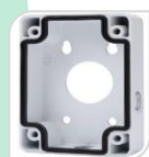
SE-PFA120 € 48,00