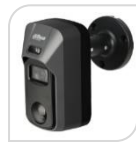
CVI-HAC- ME2241CP € 198,00

Telecamera HDCVI da esterno/interno IP67 Deterrenza attiva con Luce Bianca e Sirena , Allarme preciso via PIR & Motion Dual-detection; sensore CMOS progressivo 1/2.8", risoluzione 1080p con 25/30Fps, ICR auto, ottica fissa 2.8mm f1.6, luminosità 0.004Lux f1.6 (0 con Led ON), tecnologia Starlight, portata Led IR fino a 20mt, 1 ingresso audio con MICROFONO incorporato, 2D e 3D, WDR (120db), PIR 15mt, 110°, protocollo wireless Airfly, 12Vdc <5.5W ACCESSORI: PFA134 , PFA152-E *DIMENSIONI: 144.7x76,7x146,4mm *PESO: kg. 0.41