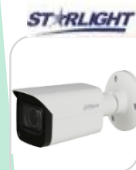
CVI-HAC- HFW2501TUP-Z-A € 305,00

BULLET 5MP - HDCVI/TVI/CVBS/AHD , ottica 2.7-12mm – MOTORIZZATA - AUTOFOCUS gestito manualmente dal dvr – D-WDR, 2DNR 0.02Lux/F1.8, 0Lux IR on- Max 5MP 20@5MP - Max. IR distanza 60m , Smart IR – 4 MAX LED, IP67, DC12V – ALLUMINIO - MICROFONO ACCESSORI OPZIONALI: PFA130E - PFA122 - PFA152 *DIMENSIONI: 210mm×90.4mm x 90.4mm *PESO: Kg 0.55