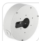
SE-PFA13F € 64,00

WATER-PROOF BOX DI GIUNZIONE – MATERIALE: IN ALLUMINIO & SECC - BIANCO DIMENSIONI: 138x42mm – PESO: kg 0.38 CARICO: 3Kg TEMPERATURA -40°C +60°C UMIDITA': <90% RH