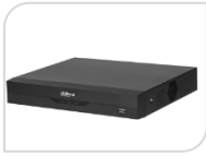
XVR5108HS-I3 € 340,00