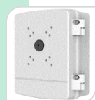
SE-PFA140 € 300,00

WATER-PROOF BOX DI GIUNZIONE – MATERIALE: IN ALLUMINIO - BIANCO DIMENSIONI: 115x160x37 mm PESO: kg 0.53 CARICO: 7Kg TEMPERATURA -40°C +60°C UMIDITA' <90%RH