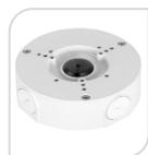
SE-PFA130-E € 34,00

WATER-PROOF BOX DI GIUNZIONE MATERIALE: IN ALLUMINIO BIANCO PROTEZIONE: IP66 – DIMENSIONI: 134x33.5x56mm PESO: kg 0.54 CARICO: Kg 3 TEMPERATURA -40°C +60°C UMIDITA': <90% RH