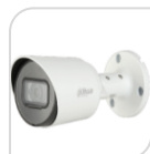
CVI-HAC- HFW1500TP-A 122,00

BULLET 5MP HDCVI/TVI/CVBS/AHD 5.0Mp , ottica 2,8 1/2.8" CMOS risoluzione , D-WDR, 2DNR, BLC/HLC/ 0.02Lux/F1.6, 30IRE, 0Lux IR , IR distanza 30m, Smart IR - 1 LED - IP67, DC12V - ALLUMINIO ACCESSORI OPZIOANLI: PFA134 – PFA152-E *DIMENSIONI: 176mm×72.4 mm×72.5 mm *PESO: Kg 0.37