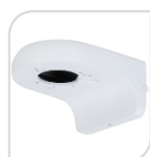
SE-PFB205W € 33,60

STAFFA PER MONTAGGIO A PARETE WATER-proof IN ALLUMINIO - BIANCO DIMENSIONI: 160x122x76mm PESO: kg 0.49 CARICO: Kg 1.0 TEMPERATURA -40°C +60°C UMIDITA' <90%RH