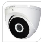
CVI-HAC-T2A21 NON DISPONIBILE

DOME IR 4IN1 -HDCVI/TVI/CVBS/AHD 2.0Mp ottica 2,8 da interno con sensore progressivo 1/2.7" CMOS da, risoluzione 1.080p con 25Fps o 720p con 25/50 Fps, ICR meccanico, luminosità 0.04Lux (0 con LED ON), D-WDR, BLC-HLC , IR portata fino a 20mt, 2 D,uscita video HD o BNC, OSD su cavo coassiale, alimentazione 12Vdc -tecnologia switchabile da menu del dvr Dahua o con telecomando PFM820 - non in dotazione - PLASTICA ACCESSORI OPZIONALI: PFA13A - PFB204W - PFA152-E *DIMENSIONI Ø85,5mm×68mm *PESO Kg 0,09