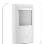
4/1 SE-ATC1080G1PIR € 170,00

TELECAMERA 4 IN 1 -AHD/TVI/CVI/Analog - PIR CAM finto sensore 2.0 Megapixel 1080P, lente 3.7mm pinhole , dip switch per cambio tecnologia – snodo incluso