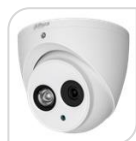
CVI-HAC-HDW1200EM-A-S6 € 92,00

DOME IR camera HDCVI - 4IN1 -HDCVI/TVI/CVBS/AHD 2.0Mp , ottica da 2.8mm da esterno/interno IP67 con sensore progressivo 1/2.8" CMOS da, risoluzione 1.080p con 25Fps o 720p con 25/50 Fps, ICR, luminosità 0.02Lux (0 con LED ON), led IR portata fino a 50mt, 2 D, uscita video HD-CVI o PAL, OSD su cavo coassiale, alimentazione 12Vdc <5W - ALLUMINIO ACCESSORI OPZIONALI: PFA139- PFA130E- PFB204W-PFB152 *DIMENSIONI: Ø106mm×93.7mm *PESO: Kg0.30