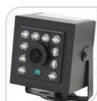
4/1 SE-ATC1080EB € 86,00

TELECAMERA 4 IN 1 -AHD/TVI/CVI/Analog – PIR CAM con sensore funzionante con AUDIO 2.1Megapixel 1080P, CMOS SONY , lente 3.7mm pinhole con 24 mini led invisibili-IR Distanza 5-10Mt – snodo incluso