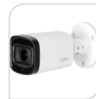
CVI-HAC- HFW1500RP-Z-IRE6-A € 210,00