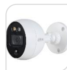
CVI-HAC- ME1500B-LED € 95,00

IR bullet HDCVI MotionEye IoT da interno/esterno IP67, Deterrenza attiva con Luce Bianca Allarme preciso via PIR & Motion Dual-detection, sensore CMOS, CMOS progressivo 1/2.7", ICR auto , DWDR, 2D, AGC, risoluzione a 1080p a 25fps, ottica fissa 2.8 mm, portata LED IR fino a 20 m, OSD, PIR 10 m e 110°, alimentazione 12 Vdc ACCESSORI: PFA134 , PFA152-E *DIMENSIONI: 46.6mmx72.4mmx83mm *PESO: kg. 0.30