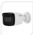
CVI-HAC- HFW1801TLP-A € 170,00

BULLET 4K –8 Mp - HDCVI/TVI/CVBS/AHD - LENTE 3.6mm -120dB - True WDR, 3DNR-risoluzione - MAX 4K – Max IR distanza 80m Smart IR – iP67 –2D/3D Day/Night -2 IR LED- DC12V Materiale: METALLO+PLASTICA ACCESSORI OPZIONALI: PFA130-E PFA152E * DIMENSIONI : 240.7x90.7x90.4mm * PESO : kg 0.410