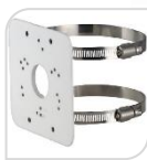
SE-PFA152-E € 36,00