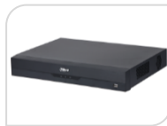
XVR5216AN-I3 € 720,00