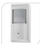
4/1 SE-ATC4MPG1 € 170,00

TELECAMERA 4 IN 1 - AHD/TVI/CVI/Analog - MINICAMERA 4 Megapixel 1/3" CMOS ,DWDR, 3D NR; lente 3.7mm pinhole