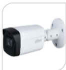
CVI-HAC- HFW1801THP-I8 € 186,00

BULLET 4K 8 Mpx , trasmissione video in tempo reale , Commutabile CVI / CVBS / AHD / TVI, MICROFONO incorporato (-A), Obiettivo fisso 2,8 mm , 1 IR LED , Distanza IR 30 m , Smart IR , IP67, 12V ± 30% DC. Materiale: METALLO ACCESSORI OPZIONALI: PFA134* PFA152-E * DIMENSIONI : 174.5mm×70.6mm×72.3mm (6.87"×2.78"×2.85") * PESO : 0.35Kg