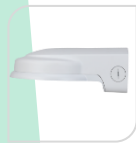
SE-PFB211W € 68,00

STAFFA PER MONTAGGIO A PARETE IN ALLUMINIO - BIANCO DIMENSIONI: 200x160x115mm PESO: kg 0.87 CARICO: Kg 5.0 TEMPERATURA -40°C +65°C UMIDITA' <90%RH