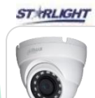
CVI-HAC-HDW1230MP-S4 € 80,00

DOME IR 2MP-HD CVI/TVI/CVBS/AHD ottica 2.8mm , Max 25 fps@5MP (uscita video 16:9), MICROFONO incorporato (-A) , Massimo IR lunghezza 60 m , Smart IR , IP67, DC12V - ALLUMINIO ACCESSORI OPZIONALI: PFA130-E, PFA137, PFB205W *DIMENSIONI: Ø121.9 mm × 99.1 mm (Ø4.8" × 3.9") *PESO: Kg 0,4