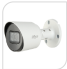
CVI-HAC- HFW1200TP € 80,00

IR BULLET 2,0 Mp HDCVI - obiettivo fisso da 3,6mm/2,8mm - Max. 30 fps @ 1080P - Uscita HD e SD commutabile - Obiettivo fisso da 3,6 mm (2,8 mm, 6 mm opzionale) - Max. Lunghezza IR 20 m, Smart IR - P67, DC12V - SERIE COPPER - luminosità 0.04Lux/F1.85, 30IRE, 0Lux IR on. - ALLUMINIO ACCESSORI OPZIONALI: PFA134 - PFA152-E *DIMENSIONI: 69.8mmx69.8mmx157.6mm *PESO: Kg 0,25