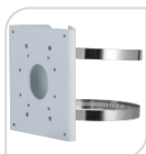
SE-PFA156 € 40,00

STAFFA DA ANGOLO MATERIALE: SECC BIANCO DIMENSIONI: 243x170x138mm TEMPERATURA:<40°C+60°C UMIDITA':<90%RH PESO: Kg 1.7 CARICO: Kg 10