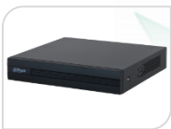
XVR1B04-I € 165,00