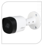
CVI-HAC- B1A21P € 55,00