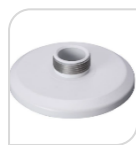
SE-PFA101 € 20,00

ADATTATORE MATERIALE: IN ALLUMINIO - BIANCO DIMENSIONI: 150,8x37mm PESO: kg 0.21 CARICO: Kg 3.0 TEMPERATURA: -40°C +60°C UMIDITA' <90%RH