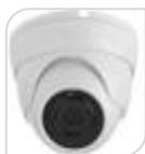
4/1 SE-MID-36-4MPA € 96,00

DOME IR 4.0Mega Pixel (2500*1600p) - uscita HDCVI/TVI/AHD/CVBS 4 Megapixel - Obiettivo fisso 3,6mm - LED 24 - Distanza IR 15/20m Day/Night con filtro meccanico - IP66 in Case Metallico - DC12V ACCESSORI PFA 13A * DIMENSIONI 90 x 66 x 66 mm