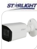
CVI-HAC- HFW2802T-A-I8 € 260,00

BULLET 4K 8 Mpx , trasmissione video in tempo reale , Commutabile CVI / CVBS / AHD / TVI , MICROFONO incorporato (-A), Obiettivo fisso 2,8 mm , 2 IR LED , Distanza IR 40 m , Smart IR , IP67, 12V ± 30% DC. Materiale: METALLO+PLASTICA ACCESSORI OPZIONALI: PFA134 - PFA152-E - PFA12A * DIMENSIONI : 204,7mm×90,7mm×90,4mm (6.87"×2.78"×2.85") * PESO : 0.28Kg