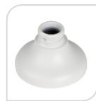
SE-PFA107 € 25,00

ADATTATORE IN ALLUMINIO – BIANCO DIMENSIONI: \Phi 134.1mmx83.5mm PESO: 0.29kg CARICO: Kg 1 TEMPERATURA: -40°C ~+ 60°C UMIDITA': <90%RH ADATTO AI MODELLI: PFB305W – PFB220C