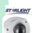
CVI-HAC-HDBW2241F-A € 186,00

DOME IR camera STARLIGHT , HDCVI/TVI/CVBS/AHD 2.0Mp ottica 2,8mm, 120dB true WDR, 3DNR, Massimo 30fps@1080P, Uscita HD/SD commutabile, Interfaccia audio in, microfono integrato, Obiettivo fisso da 3,6 mm (2,8 mm, 6 mm opzionale), Massimo IR lunghezza 50 m, Smart IR, IP67, DC12V±30%. ACCESSORI OPZIONALI: PFA130-E, PFB204-W, PFA152-E *DIMENSIONI: Ø106mm×99.2mm (Ø4.17"×3.9") *PESO: Kg 0,50