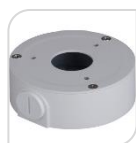
SE-PFA134 € 26,00

WATER-PROOF BOX DI GIUNZIONE MATERIALE: IN ALLUMINIO BIANCO PROTEZIONE: IP66 – DIMENSIONI: 124x41mm PESO: kg 0.35 CARICO: Kg 3 TEMPERATURA -40°C +60°C UMIDITA': <90% RH