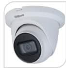
CVI-HAC-HDW1200TMQ-A NON DISPONIBILI

DOME IR camera HDCVI - 4IN1 -HDCVI/TVI/CVBS/AHD 2.0Mp , ottica da 2.8mm da esterno/interno IP67 con sensore progressivo 1/2.8" CMOS, MICROFONO , risoluzione 1.080p con 25Fps o 720p con 25/50 Fps, ICR, luminosità 0.02Lux (0 con LED ON), led IR portata fino a 50mt, 2 D, uscita video HD-CVI o PAL, OSD su cavo coassiale, alimentazione 12Vdc <5W - ALLUMINIO ACCESSORI OPZIONALI: PFA139- PFA130E- PFB204W-PFB152 *DIMENSIONI: Ø106mm×93.7mm *PESO: Kg0.30