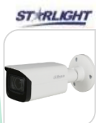
CVI-HAC- HFW2241T-I8 € 160,00

IR BULLET 2.0 Mp , Massima risoluzione 30 fps@1080P, STARLIGHT, 130 dB true WDR, 3D NR, Obiettivo fisso da 2,8 mm , CVI/CVBS/AHD/TVI commutabile, luminosità 0.002 Lux/F1.6, 30 IRE, 0 Lux IR on , Lunghezza max. IR 30 m, numero illuminatori 2, Smart IR, IP67, DC12V. ALLUMINIO ACCESSORI OPZIONALI: PFA134 - PFA130-E- PFA152-E *DIMENSIONI: 166.6 mm x 69.7 mm x 70.0 mm *PESO: 0.33 kg