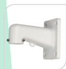
SE-PFB305W € 46,00

STAFFA PER MONTAGGIO A PARETE IN ALLUMINIO - BIANCO DIMENSIONI: 115x160x255mm PESO: kg 0.66 CARICO: Kg 7.0 TEMPERATURA -40°C +65°C UMIDITA' <90%RH