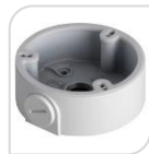
SE-PFA135 € 25,00

WATER-PROOF BOX DI GIUNZIONE – MATERIALE: IN ALLUMINIO - BIANCO DIMENSIONI: 155x155x39mm PESO: kg 0.47 CARICO: 3Kg TEMPERATURA -40°C +60°C UMIDITA' <90%RH