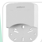
SE-PFA12A € 10,00

WATER-PROOF BOX DI GIUNZIONE – MATERIALE: IN ALLUMINIO - BIANCO DIMENSIONI: 108x28,5mm – PESO: kg 0.16 CARICO: 1Kg TEMPERATURA -40°C +60°C UMIDITA' <90%RH