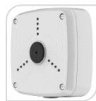
SE-PFA122 € 46,00

WATER-PROOF BOX DI GIUNZIONE MATERIALE: ALLUMINIO BIANCO- PROTEZIONE: IP66 DIMENSIONI: 134x133.5x56mm PESO: kg 0.54 CARICO: Kg 3 TEMPERATURA -40°C +60°C UMIDITA': <90% RH