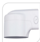
SE-PFB210W € 68,00

STAFFA PER MONTAGGIO A PARETE WATER-proof IN ALLUMINIO - BIANCO DIMENSIONI: 161.6 mm x 125.6 mm x 76.0 mm PESO: 0.49 kg CARICO: Kg 2,0 TEMPERATURA -40°C +60°C UMIDITA' <90%RH