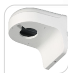
SE-PFB203W € 32,00