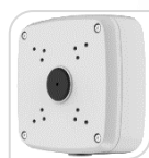
SE-PFA121 € 46,00