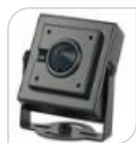
4/1 SE-ATC1080EA € 106,00

TELECAMERA 4 IN 1 - AHD/TVI/CVI/Analog – MINICAMERA 2.4Megapixel 1080P - lente 3.6mm con 10 IR LEDs,IR Distanza 8Mt,