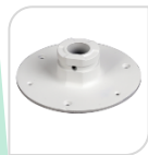
SE-PFA108 € 24,00

ADATTATORE IN ALLUMINIO – BIANCO DIMENSIONI: \Phi 134.1mmx83.5mm PESO: 0.29kg CARICO: Kg 1 TEMPERATURA: -40°C ~+ 60°C UMIDITA': <90%RH ADATTO AI MODELLI: PFB305W – PFB220C