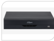
XVR5116HS-I3 € 540,00