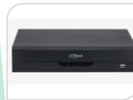
XVR5232AN-S2 € 960,00