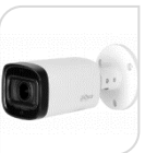
CVI-HAC- HFW1801RP-Z € 275,00