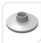
SE-PFA103 € 20,00

ADATTATORE IN ALLUMINIO – BIANCO DIMENSIONI: \Phi 169mmx37mm PESO: Kg 0,25 CARICO: Kg 3.0 TEMPERATURA: -40°C ~+ 60°C UMIDITA': <90%RH