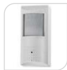
4/1 SE-PIR 37 € 74,00

TELECAMERA 4 IN 1 -AHD/TVI/CVI/Analog – mini PIR CAM finto sensore 2.1Megapixel 1080P, UTC, D-WDR,3D NR , lente 3.7mm pinhole con 18 mini led invisibili- IR Distanza 5-10Mt – snodo incluso