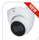
CVI-HAC-HDW1200TLMP-S6 € 78,00

DOME IR 4IN1 -HDCVI/TVI/CVBS/AHD 2.0Mp ottica 2,8 da esterno/interno IP67 con sensore progressivo 1/2.7" CMOS da, risoluzione 1.080p con 25Fps o 720p con 25/50 Fps, ICR meccanico, luminosità 0.04Lux (0 con LED ON), D-WDR, BLC-HLC , IR portata fino a 20mt, 2 D,uscita video HD o BNC, OSD su cavo coassiale, alimentazione 12Vdc - ALLUMINIO ACCESSORI OPZIONALI: PFA13A - PFB204W - PFA152-E - tecnologia switchabile da menu del dvr Dahua o con telecomando PFM820 - non in dotazione *DIMENSIONI Ø94mm×78mm *PESO Kg 0,27