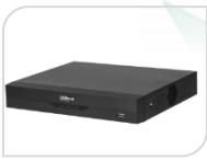
XVR5104HS-I3 € 240,00