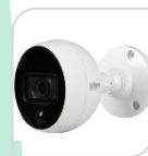
CVI-HAC- ME2802B € 196,00