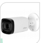
CVI-HAC- HFW1801RP-Z-A € 290,00

BULLET 4K –8 Mp - HDCVI/TVI/CVBS/AHD - LENTE 2.7-13.5mm MOTORIZZATA AUTOFOCUS ,120dB WDR 3DNR- risoluzione -MAX 4K – HD/SD switchable- Max.IR 60mt Smart IR – IP67 –2D/3D – Day/Night - 4 IR LED- DC12V - ALLUMINIO ACCESSORI OPZIONALI: PFA130-E – PFA135 - PFA152E PFA151 * DIMENSIONI : 209.9x90.4x90.4mm * PESO : kg 0.55