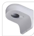
SE-PFB204W € 32,00

STAFFA PER MONTAGGIO A PARETE WATER-proof IN ALLUMINIO - BIANCO DIMENSIONI: 160x122x76mm PESO: kg 0.57 CARICO: Kg 1.0 TEMPERATURA -40°C +60°C UMIDITA' <90%RH