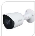
CVI-HAC- HFW1200TP-A € 86,00

IR BULLET 2.0 Mp - 4IN1 HDCVI/TVI/CVBS/AHD - 2.8 o 3.6mm - Max risoluzione 1080P frame 30fps@1080P 25/30/50/60fps@720P da esterno/interno IP67 - sensore CMOS progressivo 1/2.7" ; luminosità 0.02Lux (0 con LED ON), 1 led IR portata fino a 20m, 2D, uscita video HD-CVI, alimentazione 12V-Digital WDR-AGC-2D NR- in dotazione staffa di fissaggio - IP67- ACCESSORI PFA134 - PFA152-E (PFM820 telecomando per cambio tecnologia)- ALLUMINIO *DIMENSIONI: 176x72.4x72.5mm *PESO: Kg 0.34