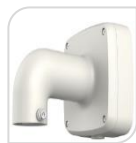
SE-PFB302S € 78,00

STAFFA PER MONTAGGIO A PARETE IN ALLUMINIO - BIANCO DIMENSIONI: 229,7x168,7x113,2mm PESO: kg 0.93 CARICO: Kg 3,0 TEMPERATURA -40°C +65°C UMIDITA' <90%RH