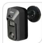
CVI-HAC- ME1500C € 150,00

Telecamera HDCVI da esterno/interno IP67 Deterrenza attiva con Luce Bianca e Sirena Allarme preciso via PIR & Motion Dual-detection; sensore CMOS progressivo 1/2.8", risoluzione 1080p con 25/30Fps, ICR auto, ottica fissa 2.8mm f1.6, luminosità 0.004Lux f1.6 (0 con Led ON), tecnologia Starlight, portata Led IR fino a 20mt, 1 ingresso audio con MICROFONO incorporato, 2D e 3D, WDR (120db), PIR 15mt, 110°, 12Vdc <5.5W ACCESSORI: PFA134 , PFA152-E *DIMENSIONI: 144.7x76,7x146,4mm *PESO: kg. 0.41