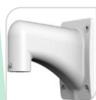
SE-PFB303W € 48,00

STAFFA PER MONTAGGIO A PARETE IP66 IN ALLUMINIO - BIANCO DIMENSIONI: 134x133,5x187,5mm PESO: kg 7 CARICO: Kg 4 PROTEZIONE IP66 TEMPERATURA -40°C +65°C UMIDITA' 0~90%RH