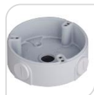
SE-PFA136 € 25,00

WATER-PROOF BOX DI GIUNZIONE – MATERIALE: IN ALLUMINIO - BIANCO DIMENSIONI: 90x34,1mm – PESO: kg 0.16 CARICO: 1Kg TEMPERATURA -40°C +60°C UMIDITA' <90% RH