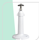
SE-PFB110W € 18,00

STAFFA PER MONTAGGIO A PARETE IN ALLUMINIO - BIANCO DIMENSIONI: 235.4 mm x 180.3 mm x 84.2 mm PESO: kg 0,97 CARICO: Kg 3 TEMPERATURA -40°C to +60°C UMIDITA' 0~90%RH