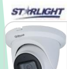
CVI-HAC-HDW1231TMQP-A € 110,00

DOME IR 4IN1 STARLIGHT -HDCVI/TVI/CVBS/AHD 2.0Mp ottica 3.6mm da esterno/interno IP67 con sensore progressivo 1/2.8" CMOS da, risoluzione 1.080p con 25Fps o 720p con 25/50 Fps, ICR meccanico, luminosità 0.005Lux (0 con LED ON), D-WDR, BLC-HLC , 12led IR portata fino a 30mt, 2 D,uscita video HD o BNC, OSD su cavo coassiale, alimentazione 12Vdc <5W - ALLUMINIO tecnologia switchabile da menu del dvr Dahua o con telecomando PFM820 - non in dotazione ACCESSORI OPZIONALI: PFA13A-E - PFA130/E - PFB204W - PFA152-E *DIMENSIONI: Ø93.4mm×79.7mm *PESO: Kg 0,27