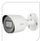
CVI-HAC- HFW1500TP € 110,00

BULLET 5MP HDCVI/TVI/CVBS/AHD 5.0Mp , ottica 2,8m , interno/esterno, 1/2.8" CMOS risoluzione , D-WDR, 2DNR, BLC/HLC/ 0.02Lux/F1.6, 30IRE, 0Lux IR , IR distanza 30m, Smart IR - IP67, DC12V - PLASTICA ACCESSORI OPZIOANLI: PFA134 – PFA130-E - PFA152-E *DIMENSIONI: 161.3 mm × 69.7 mm × 70.0 mm *PESO: 0.19 kg