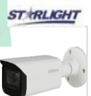
CVI-HAC- HFW2802TP-Z-A € 380,00

BULLET 4K –8 Mp - HDCVI/TVI/CVBS/AHD - LENTE 2.7-13.5mm MOTORIZZATA AUTOFOCUS ,120dB WDR 3DNR- risoluzione -MAX 4K – HD/SD switchable - Max.IR 60mt Smart IR – IP67 –2D/3D – Day/Night - 4 IR LED- DC12V - MICROFONO integrato - ALLUMINIO ACCESSORI OPZIONALI: PFA130-E – PFA135 - PFA152E PFA151 * DIMENSIONI : 209.9x90.4x90.4mm * PESO : kg 0.55