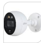
CVI-HAC- ME1200B-LED € 75,00