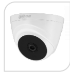
CVI-HAC-T1A21 € 55,00