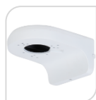
SE-PFB205W-E € 38,00

STAFFA PER MONTAGGIO A PARETE WATER-proof IN ALLUMINIO - BIANCO DIMENSIONI: 160x122x76mm PESO: kg 0.49 CARICO: Kg 2.0 TEMPERATURA -40°C +60°C UMIDITA' <90%RH